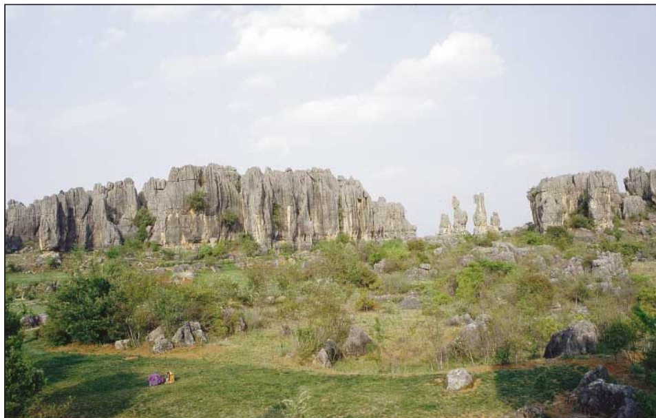
Sl. 1: Naigu kamniti gozd. Fig. 1: The Naigu stone forest.