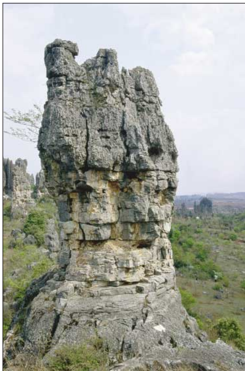
Fig. 4: The peak of rock pillar with funnel-shaped notches and channels. The roughness of the rocky surface is due to rock lithology.

Sl. 5: Del kamnitega gozda v skladih kamnine skupin A, B in C z značilno oblikovanim vrhom, ožjim in hitreje razpadajočim srednjim delom ter obstojnejšim spodnjim delom.