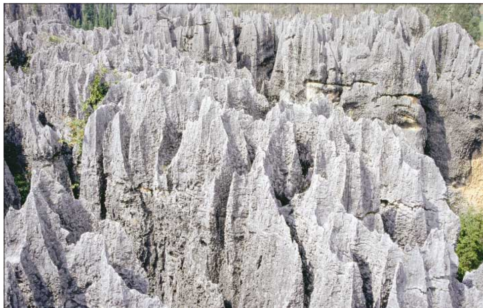
Fig. 5: One part of the stone forest in the rock layers of A, B and C groups with characteristically shaped peaks, more narrow and easily weathered medium part and more resistant lower part.

Sl. 5: Del kamnitega gozda v skladih kamnine skupin A, B in C z značilno oblikovanim vrhom, ožjim in hitreje razpadajočim srednjim delom ter obstojnejšim spodnjim delom.