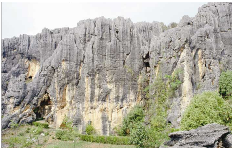
Sl. 3 (Besedilo je na strani 19) - Fig. 3 (Text page 19)